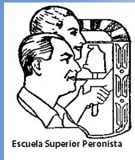
Escuela Superior Peronista

La Teoría Social Peronista o Sociología Peronista es la interpretación "Peronista" de lo social, ya que es el método con que se encara, se estudia y se resuelve los problemas sociales de acuerdo con los principios doctrinarios que el Peronismo establece. Es esta orientación propia, la razón que califica a nuestro Sociología como "Peronista".